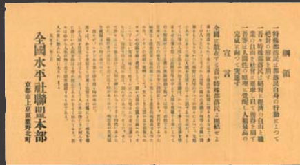
全国水平社第2回大会綱領・宣言