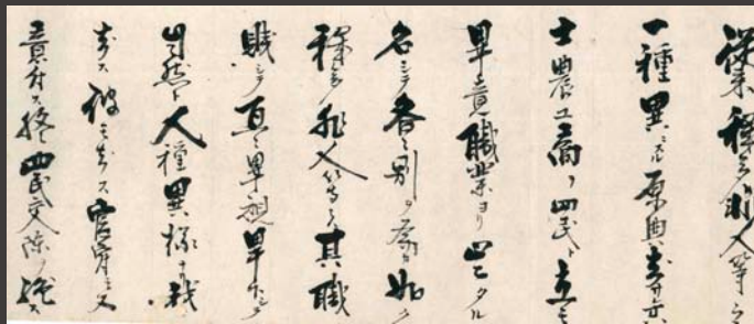
「解放令・堺県布達」

・大阪メトロ谷町線・京阪電車「天満橋駅」より西へ300m ・大阪メトロ堺筋線・京阪電車「北浜駅」より東へ500m