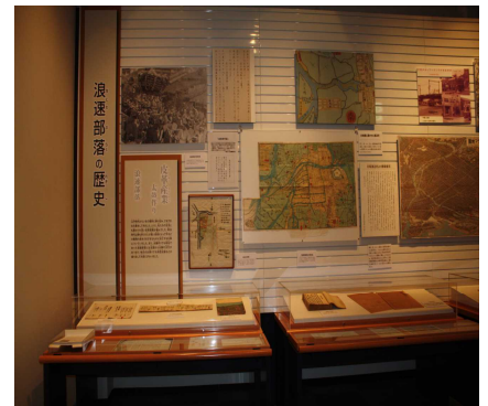
浪速部落の歴史コーナー