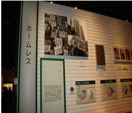
ホームレスのコーナー

また、昨年度反響のあった、特別展「いじめと差別」、企画展「水俣病に向き合った医師たち」をリメイクしております。