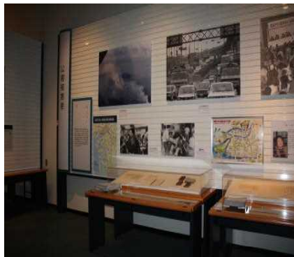
公害被害者のコーナー