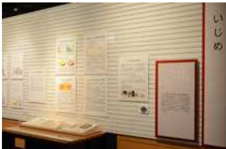
いじめのコーナー